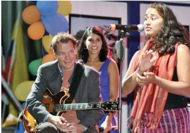
Die Kombination von Musik, Erkenntnissen aus Psychologie, Philosophie und das, was El Hierro an Besonderem bietet, ist der Schlüssel zum Erfolg. Events und Performances sind ein schönes Nebenprodukt, Prozess ist alles.

Man muss unbedingt die Falle vermeiden, eine rein akademische Veranstaltung zu sein und froh den Gleichgesinnten zu predigen. Deswegen wollen wir uns gerade auch all' jenen mitteilen, die nicht die geringste Ahnung haben, warum wir das alles machen und erklären warum da etwas Positives und Substanzielles passiert. Wenn es gelingt, Nachbarn und lokale Community zu integrieren, ist man auf dem richtigen Weg.